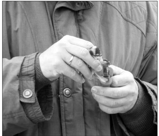
Kék cinke gyűrűzése

Ezt a területet célozta meg idei hatodik akciónapunk is, februárban, a Magyar Madártani Egyesülettel közösen. Ilyenkor azon munkák elvégzésére törekszünk, melyek az önkéntesek által jól elláthatóak. A nap folyamán mintegy negyven fő jelent meg, s a munka fő részét az előre, ill. helyben levágott cserjék összehordása jelentette. A cserje vágás a korábbi hetekben a Fitoland kivitelezésében már elkezdődött. Itt a záródó cserjés fellazítása volt a terv, nyiladékok nyitásával és azokon behatolva egy-egy területen a cserje kivágásával, kihordásával. Ezen túl, a tanösvénytől balra eső réten a két éve levágott cserje feljövő sarjait kaszáltuk, és gyűjtöttük be. A cserjésben kiszélesített tanösvény szakasz felől is nyitot-