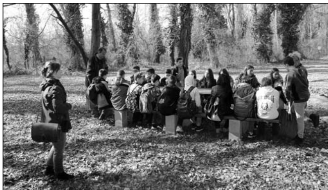
Iskolások a Hunyadi-szigeten

Márciusban a Kolonics György Általános iskola két osztályát kalauzoltuk a Tétényi fennsíkon és a Hunyadi szigeten, az ismerd meg a lakóhelyedet napok keretében, ami nagyon hasznos kezdeményezés a gyerekek számára. Mindkét sétát, a fennsík és a Hunyadi sziget tanösvényen élvezték, a legtöbbszámára újdonság volt, hogy közvetlen környezetükben ilyen értékek és érdekességek vannak. Követendő lehet a kezdeményezés, nemcsak az iskolák számára.