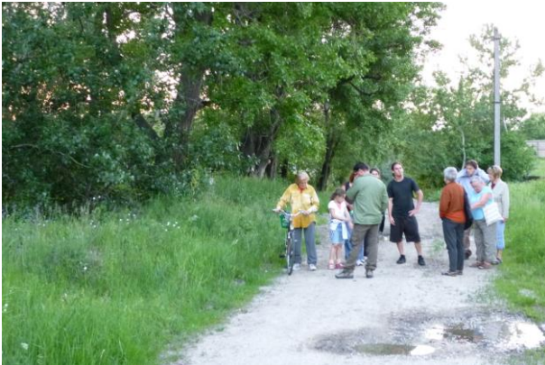
Indulás a part menti facsoportnál