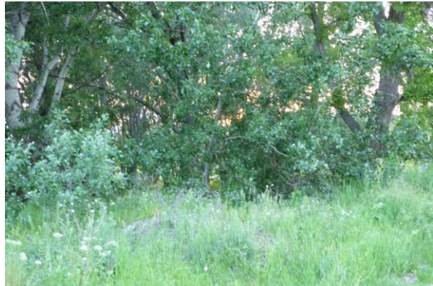
Naplemente a nyárok mögött