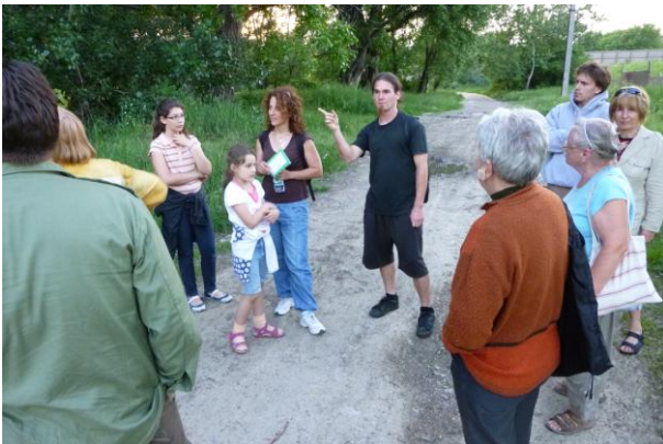
Itt hallik valami szép